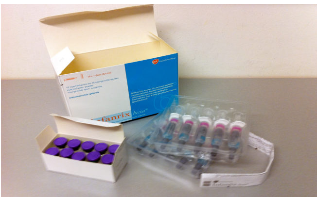
Afmeting: 150 x 110 x 60 mm